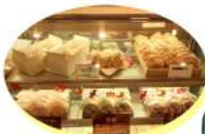
▲定番のくりーむパンをはじめ 期間限定商品も販売しています!