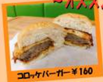
コロッケバーガー ¥160