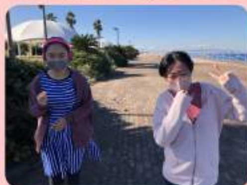
戸外活動のウォーキングで リフレッシュ！！