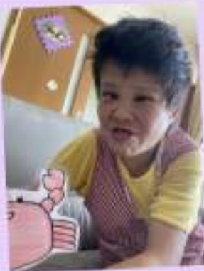
観察り♪ カニシューレット！