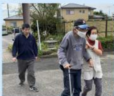
身体を動かすことが苦手の利用者様も出来るだけ体を動かすように頑張っています！