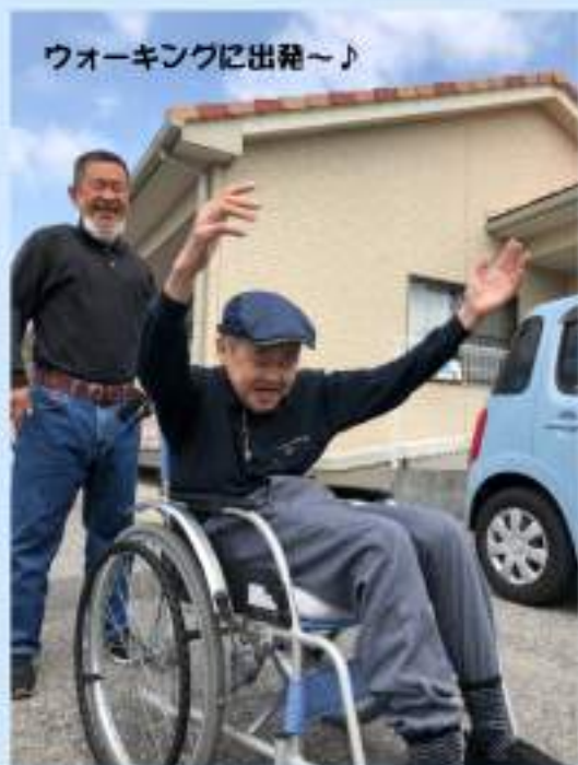
ウォーキングに出発～♪