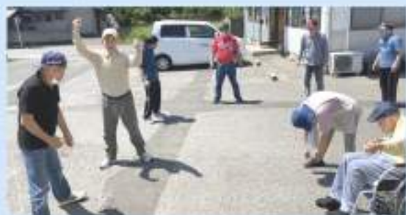
午前中はラジオ体操を行ってから！！