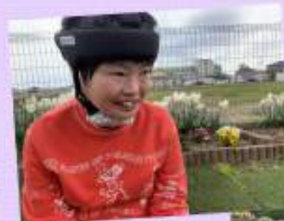
お庭でハイポーズ☆ 笑顔いっぱいの 写真が撮れました♡