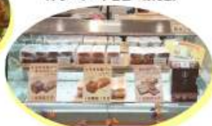
▼とろける後パンは数量限定販売! (プレーン・チョコ・あんこ)