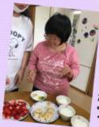
ミルクプリンを作ったよ♪