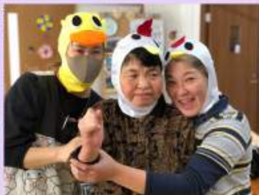
毎年恒例！ハロウィン衣装～♪