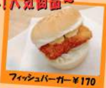
フィッシュバーガー ¥170