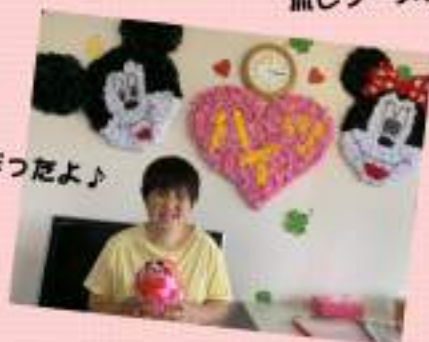
アマビエ工作ったよ♪