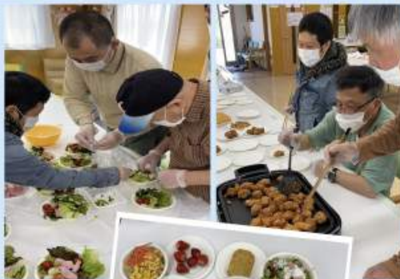
感染対策をしながら調理実習を行いました♪