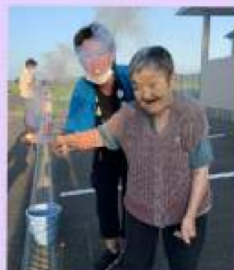
ハイム花火大会もしました☆