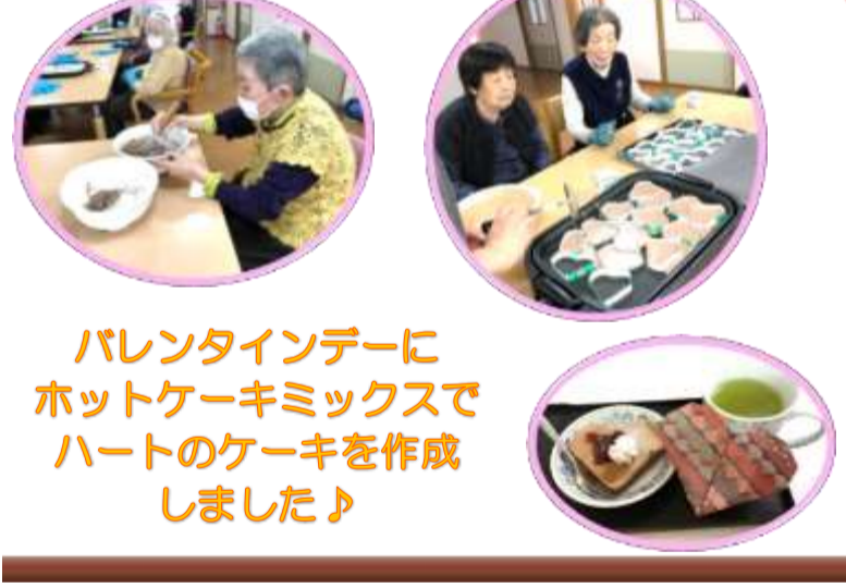
バレンタインデーに ホットケーキミックスで ハートのケーキを作成 しました♪